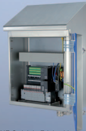
AirLINE Quick in Edelstahl